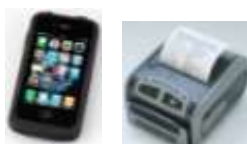
Iphone、Ipod touch モバイルプリンタ