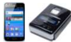
NTT docomo GALAXY S II モバイルプリンタ